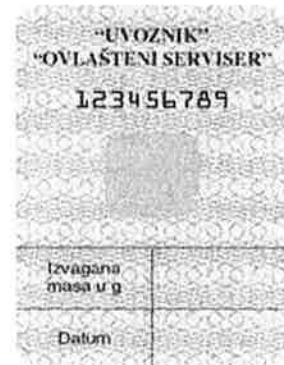
Slika 3. a